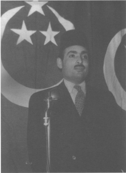
أحمد حسين زعيم مصر الفتاة